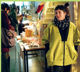
HUSH HUSH MARKET

HUSH HUSH Market (11. – 12. 4., Muzej suvremene umjetnosti) okuplja mlade hrvatske dizajnere i predstavlja njihovu odjeću, modne dodatke, nakit i kuhinjske sitnice. Očekujte pametan dizajn, dobre razgovore i komade koje ćete stvarno nositi i koristiti. Dodite znatiželjni, otidite nadahnuti.