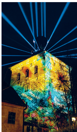
SAMIR CERIC KOVACEVIC

Trg kralja Tomislava Uz već poznate likove, pojavljuju se i dvije potpuno nove kreacije koje doživljavaju svoje prvo prikazivanje pred publikom. Skakutava avantura Anookija donosi toplu