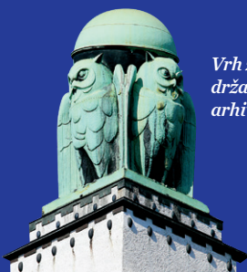
Vrh zgrade državnog arhiva

Na ovom trgu razgledajte vrhunsku zgradu u stilu art decoa, koja je dom Državnog arhiva. Na suprotnoj je strani kolosalni kip Marka Marulića, kojeg s ponosom zovemo ocem hrvatske književnosti.